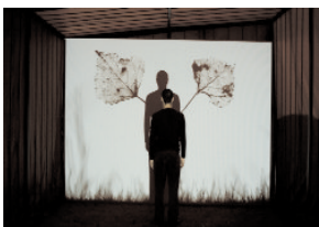
Agnès Caffier, Volières , installation, vidéoprojecteurs, écrans, ordinateurs, structures métalliques, 2006 Pièces produites dans le cadre d'une résidence au Conseil général de l'Oise

Installations, vidéoprojections dans le parc de l'abbaye Volières , première présentation publique Nuage , création pour l'abbaye de Maubuisson